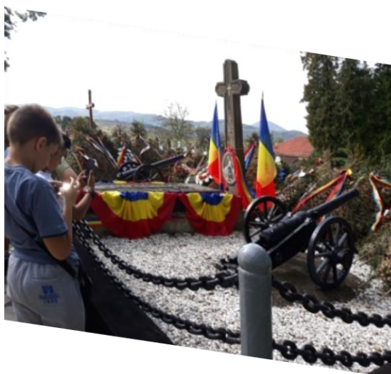
Imagini din excursie